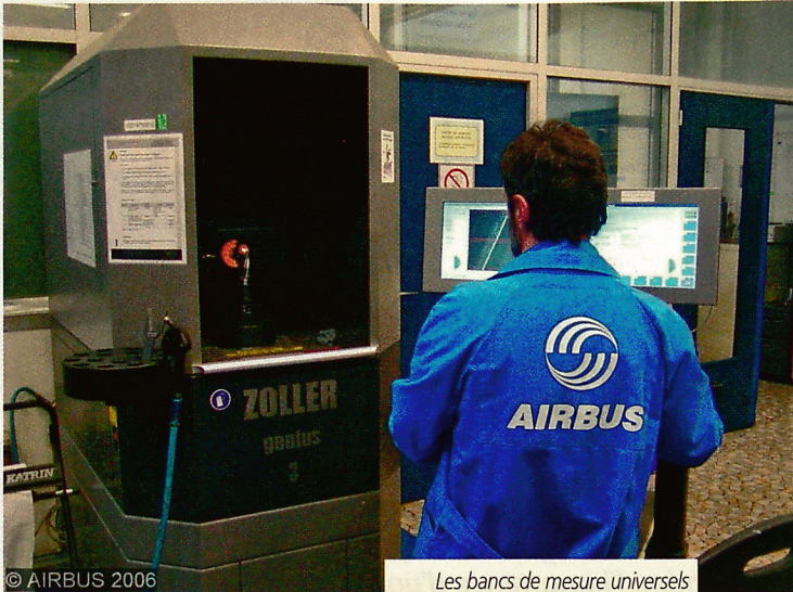
Les bancs de mesure universels Zoller genius 3 offrent une mesure complète entièrement automatique avec une interface NUMRotoplus®. Ils sont devenus les juges de paix de l'atelier d'affûtage.