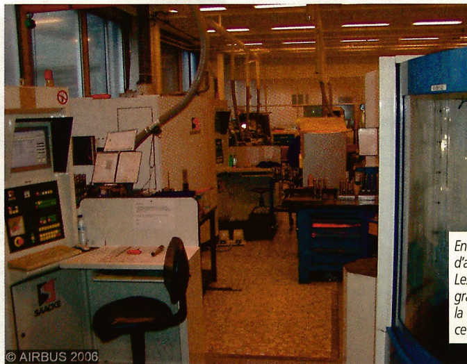
En moins de deux ans, l'atelier d'affûtage a pris une autre dimension. Les 3 machines Saacke contribuent grandement à renforcer la productivité, la qualité et l'expérience du groupe dans ce domaine.

Les machines Saacke UW1D sont des modèles de compacité et de flexibilité pour l'affûtage de tous les outils coupants. Leur cinématique autorise l'affûtage de formes les plus diverses d'hélices et d'outils complexes. Le principe de table offre toutes les possibilités d'adaptation d'accessoires tels que contre-pointe, lunette ou diamanteur. « De plus, la gestion numérique par le logiciel Numroto apporte une convivialité, une flexibilité et une technologie que l'on trouve difficilement ailleurs » nous dit M. Guibert. « Notamment, l'affûtage des listel en forme crest-cut est désormais possible en interne ».